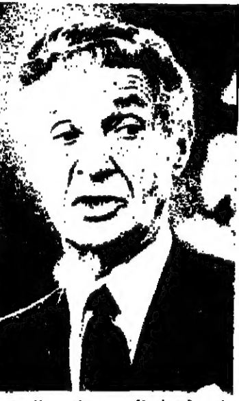
الجليلة زمام الحكم في الشهر القادم. اجتمع السيد ليفين مع رئيس الوزراء السيد مئير بيرن ووزير الخارجية شيمون بيريز.

القدس - قرر مجلس ادارة شركة كهرباء محافظة القدس امس في ختام جلسته المشتركة مع هيئة لائحة المستخدمين ترك حسم قضية استملاك امتياز الشركة لحكومة العمل العليا التي ستبت بالموضوع في نهاية الشهر الحالي. وصرح السيد تور نسيبة رئيس مجلس ادارة شركة كهرباء محافظة القدس بان الشركة حصلت على امر احترازي من محكمة العدل العليا بصد قرار الحكومة ابقاء امتياز الشركة. وكانت وزارة الطاقة قد اعدت مشروعا لتقل الادارة الشركة الى شركة الكهرباء القومية لضمان استمرار توريد المستهلكين الكهرباء وللحرب والقدس وجنوبي الضفة الغربية والجليل المحتل بضرورة منظمة.